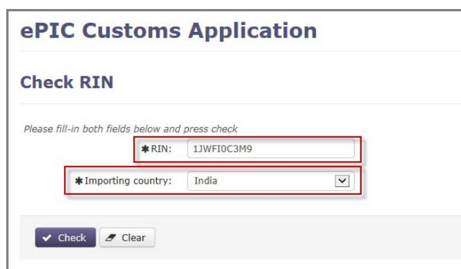
Εικόνα 2: Εισαγωγή δεδομένων

Όταν συμπληρωθούν αμφότερα τα πεδία, ο χρήστης πρέπει να πατήσει το κουμπί «Έλεγχος» για να ανακτήσει τα δεδομένα. Το αποτέλεσμα της αναζήτησης θα είναι ένα από τα εξής: