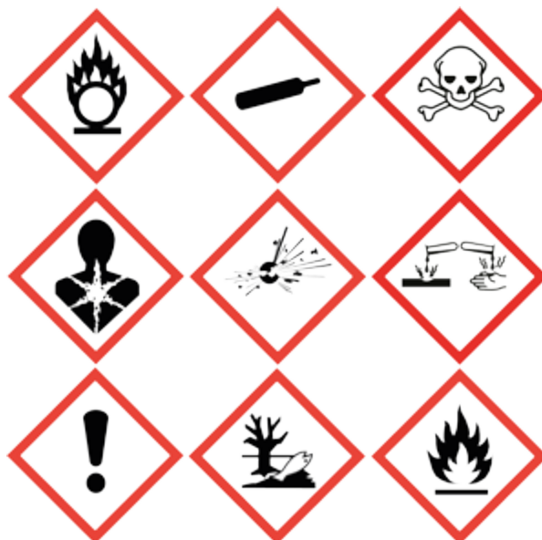
Regulamentul privind clasificarea, etichetarea și ambalarea substanțelor și a amestecurilor introduce noi pictograme.

Statele membre și industria pot propune armonizarea etichetării și clasificării unei substanțe periculoase pe întregul teritoriu al UE. Această clasificare armonizată garantează că toate societățile vor furniza clienților aceleași informații. La baza deciziilor Comisiei Europene privind armonizarea se află avizul Comitetului ECHA pentru evaluarea riscurilor, a cărui emisie este precedată de o consultare publică.