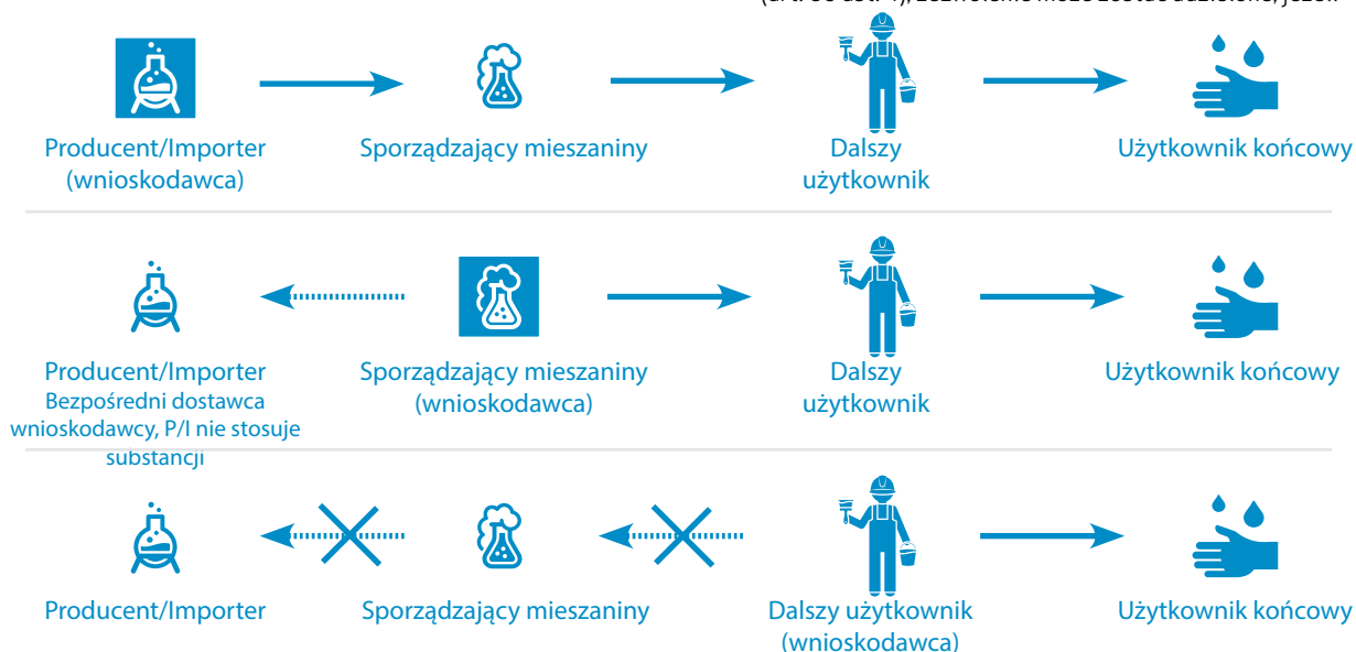
Rysunek 1. Udzielanie zezwoleń: zakres łańcucha dostaw. Strzałki wskazują na zakres zezwolenia. Uwaga: Sporządzający mieszaniny również są dalszymi użytkownikami.