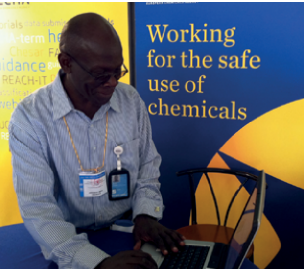
Az ICCM-3 találkozó egyik résztvevője az ECHA honlapot tanulmányozza az Ügynökség információs pultjánál Nairobiban.

a tagjelölt és potenciális tagjelölt országokra vonatkozik, az ENP az Unióval közvetlenül szomszédos 16 ország bevonására irányul. Az ECHA mindkét szakpolitikai területen hozzájárul az EU jogszabályok közelítéséhez, alkalmazásához és végrehajtásához.