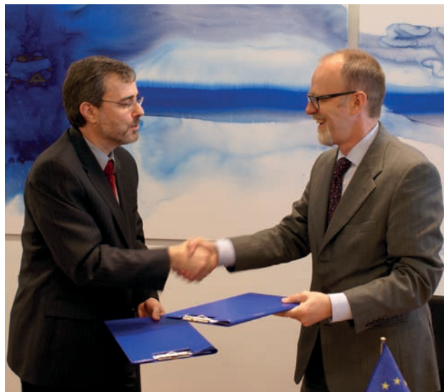
Memorandum o razumijevanju između ECHA-e i Kanade potpisan je 2010.

Dok je prva politika namijenjena zemljama kandidatima i potencijalnim kandidatima za pristup EU-u, ENP nastoji angažirati 16 zemalja koje se nalaze na neposrednim vanjskim graničama Unije. ECHA doprinosi na oba područja u pogledu približavanja, primjene i provedbe propisa EU-a.