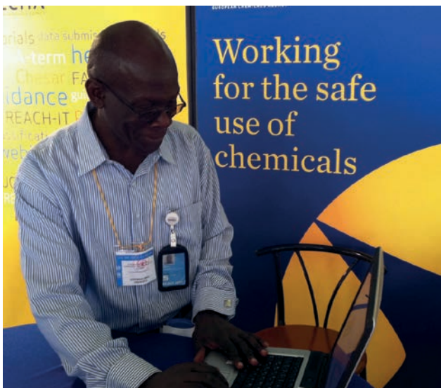
Sudionik sastanka ICCM-3 pregledava portal agencije ECHA na informativnom štandu Agencije u Nairobiju.