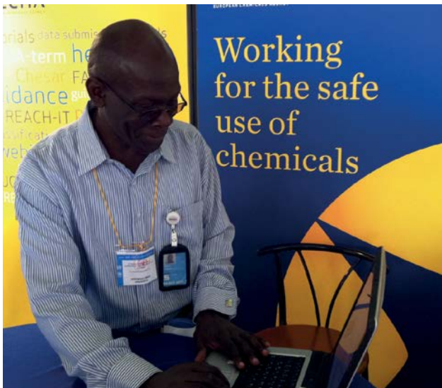
En deltagare i den tredje internationella konferensen om kemikaliehantering (ICCM-3) i Nairobi utforskar Echas webbplats vid myndighetens informationsmonter.