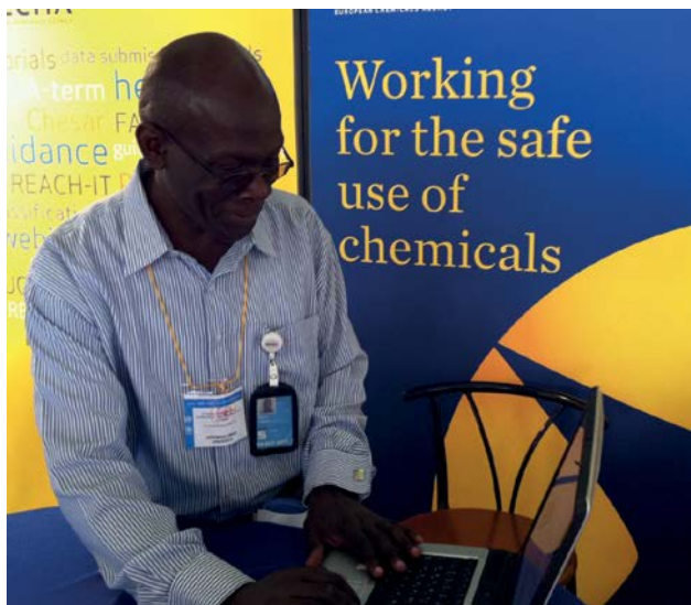
Een deelnemer van de ICCM-3-vergadering bestudeert de ECHA-website aan de informatiestand van het agentschap in Nairobi.