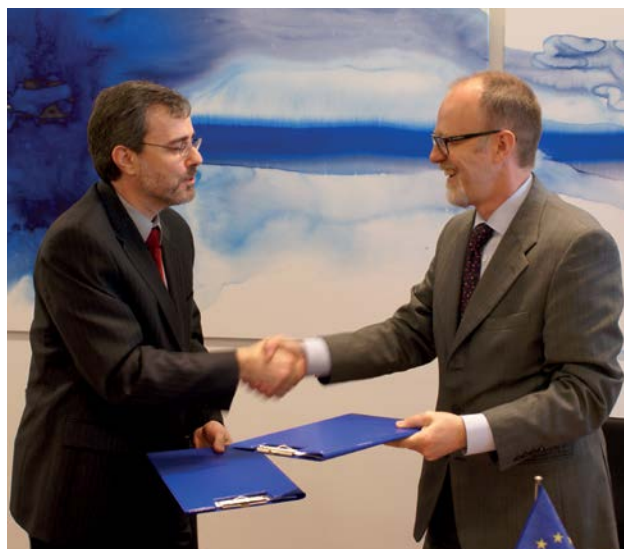
Saprašanās memorands starp ECHA un Kanādu tika parakstīts 2010. gadā.

pievienošanās ES kandidātvalstīm, bet ENP ir paredzēta Savienības 16 robežvalstu iesaistīšanai. ECHA ir sniegusi ieguldījumu abu politiku jomās saistībā ar ES tiesību aktu tuvināšanu, piemērošanu un izpildi.