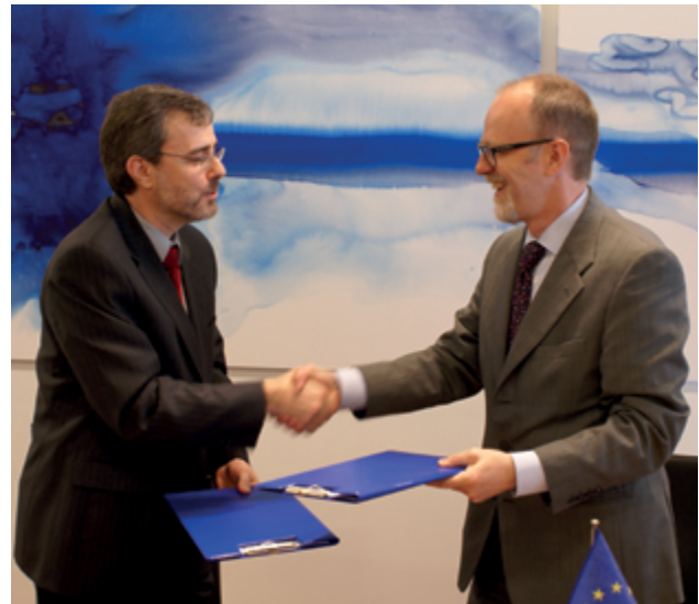
Kemikaaliviraston ja Kanadan välinen yhteisymmärryspöytäkirja allekirjoitettiin vuonna 2010.

koskee Euroopan unioniin liittymistä suunnittelevia ehdokasvaltioita ja potentiaalisia ehdokasvaltioita, kun taas naapuruuspolitiikan kohteena ovat unionin ulkorajoilla sijaitsevat 16 välitöntä rajanaapurua. Kemikaalivirasto on osallistunut työhön molemmilla politiikan aloilla lainsäädäntöjen lähentämisen sekä EU:n lainsäädännön soveltamisen ja valvonnan osalta.