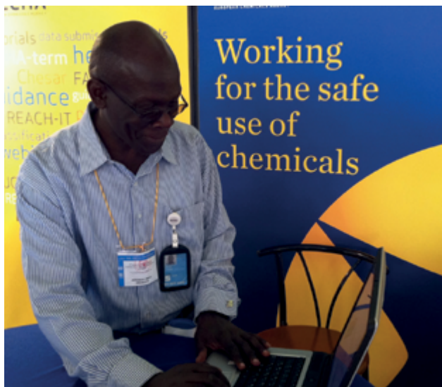
Участник в срещата ICCM-3 разглежда уебсайта на ЕСНА на информационния щанд на Агенцията в Найроби.